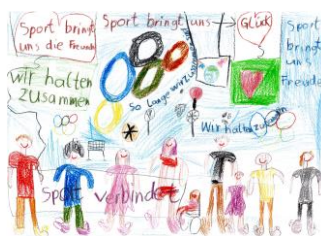
Gruppe 1, 1. Platz 2024

Für die Gruppen 1 bis 3 (Stufen 1 bis 6): Künstlerische Auseinandersetzung mit der Thematik Olympischer und Paralympischer Spiele unter besonderer Berücksichtigung der Leitthematik „Sport verbindet“. Die Bilder müssen das Format DIN A3 bzw. A4 haben. Passepartout oder Rahmen sind nicht zugelassen. Es müssen gemalte oder gezeichnete Bilder sein, also keine geklebten Bilder. Die Mal- bzw. Zeichentechnik sowie das Farbenspektrum sind freigestellt.