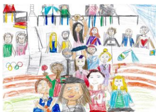
Gruppe 2, 1. Platz (2024)